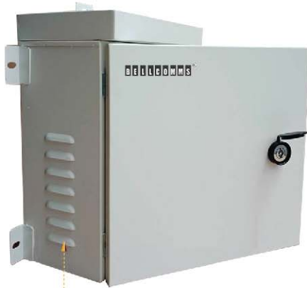
ครึ่งระบายอากาศด้านข้างซ้าย-ขวา