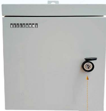
กุญแจล็อกแบบกันน้ำ