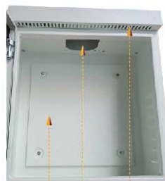
ช่องระบายอากาศ