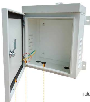
รูสำหรับร้อยสายเคเบิล